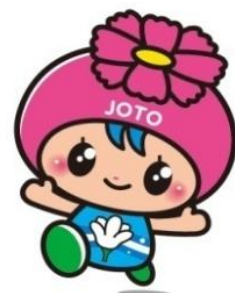
城東区マスコットキャラクター 「コスモちゃん」