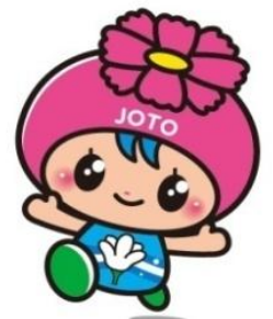
城東区マスコットキャラクター 「コスモちゃん」