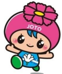
城東区マスコットキャラクター 「コスモちゃん」