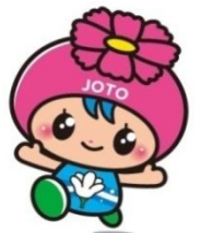
城東区マスコットキャラクター 「コスモちゃん」