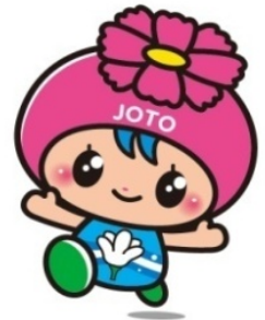
城東区マスコットキャラクター 「コスモちゃん」