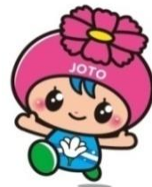
城東区マスコットキャラクター 「コスモちゃん」