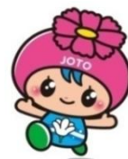
城東区マスコットキャラクター 「コスモちゃん」