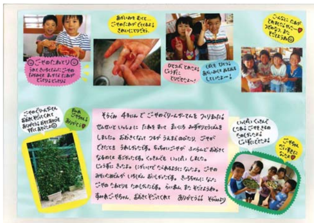
【団体の部 最優秀賞】社会福祉法人大阪福祉事業財団すみれ保育園様の作品(その3)