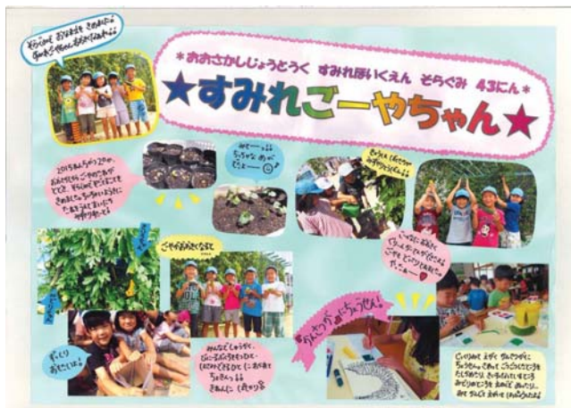
【団体の部 最優秀賞】社会福祉法人大阪福祉事業財団すみれ保育園様の作品(その1)