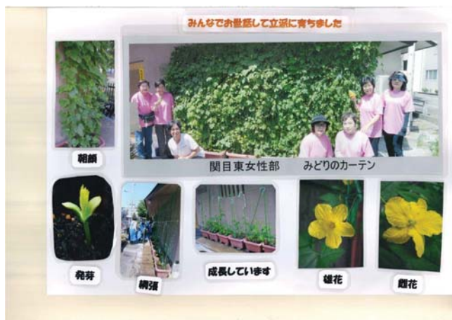
【団体の部 優秀賞】関目東連合女性部様の作品(その1)