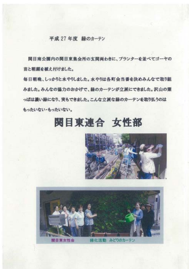
【団体の部 優秀賞】関目東連合女性部様の作品(その2)